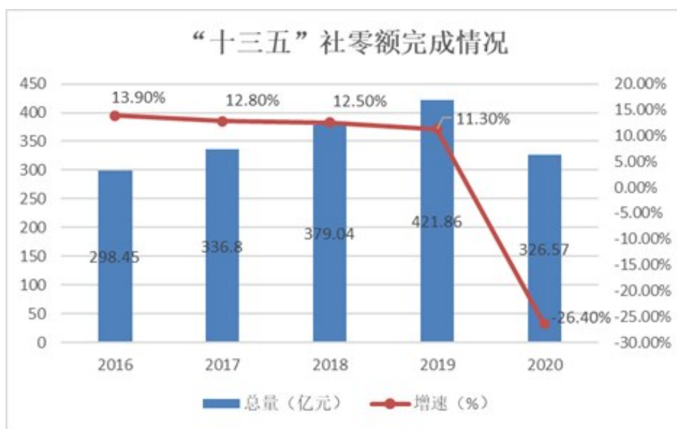
图1 “十三五”社零额完成情况